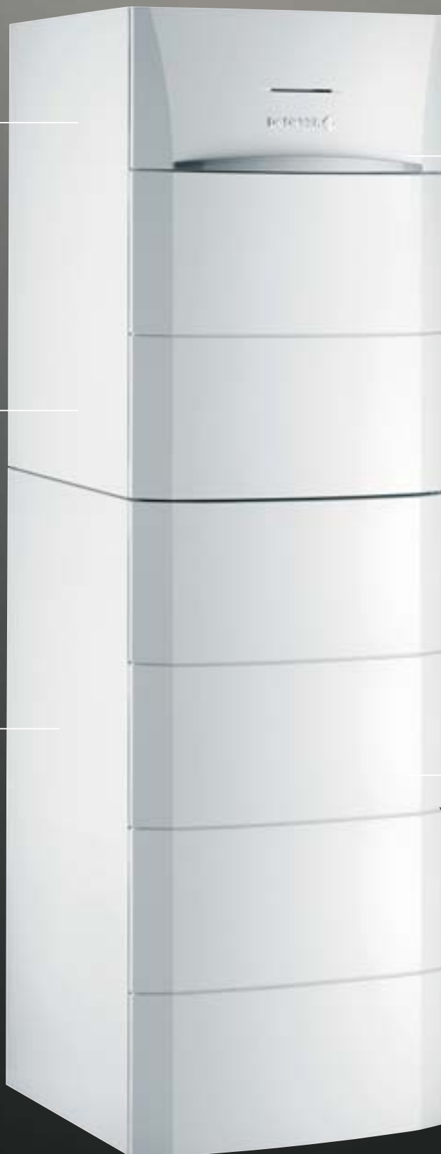
Pompe à chaleur GSHP